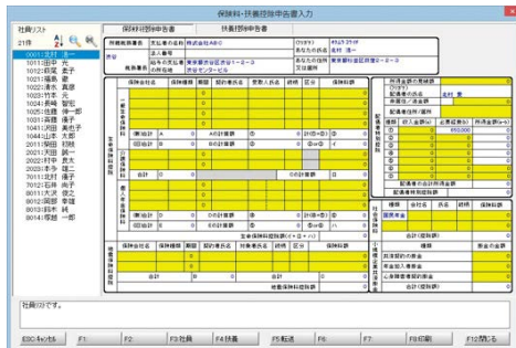
▲保険料控除申告書